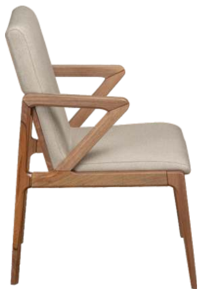
FOTO DO PRODUTO EM JEQUITIBÁ NATURAL TECIDO 0062618 PHOTO OF THE PRODUCT IN JEQUITIBÁ WOOD FABRIC 0062618 FOTO DEL PRODUCTO EN JEQUITIBÁ NATURAL TEJIDO 0062618