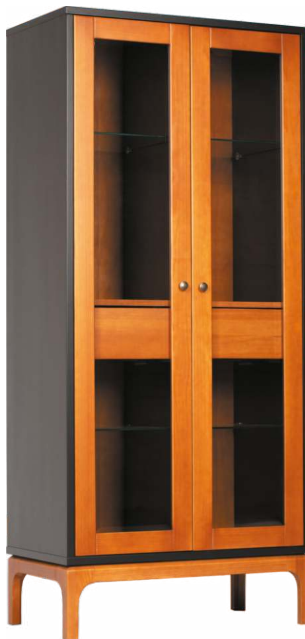
FOTO DO PRODUTO: PORTAS, PÉS E GAVETAS EM TRO01. CORPO EM TRO09. PICTURED UNIT: DOORS, LEGS AND DRAWERS IN TRO01. FRAME IN TRO09 FOTO DEL PRODUCTO: PUERTAS, PATAS Y CAJONES DE TRO01. CUERPO DE TRO09.

CxPxA / medidas em mm LxDxH / measures in mm CxPxA / medidas em mm