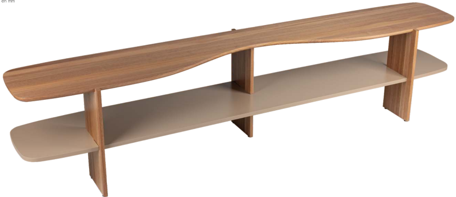
FOTO DO PRODUTO EM JEQUITIBÁ NATURAL + TR080. PHOTO OF THE PRODUCT IN JEQUITIBÁ WOOD + TR080. FOTO DEL PRODUCTO EN JEQUITIBÁ NATURAL + TR080.

CxPxA / medidas em mm LxDxH / measures in mm CxPxA / medidas en mm