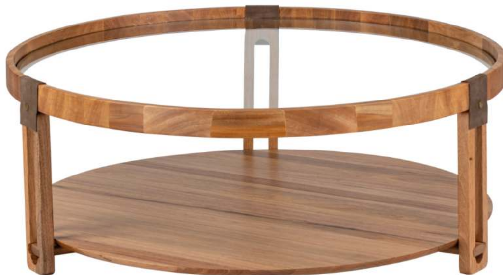
FOTO DO PRODUTO EM JEQUITIBÁ NATURAL. DETALHES EM COURO NATURAL. PHOTO OF THE PRODUCT IN JEQUITIBÁ WOOD DETAILS IN NATURAL LEATHER. FOTO DEL PRODUCTO EN JEQUITIBÁ NATURAL DETALLES EN CUERO NATURAL.

CxPxA / medidas em mm LxDxH / measures in mm CxPxA / medidas en mm