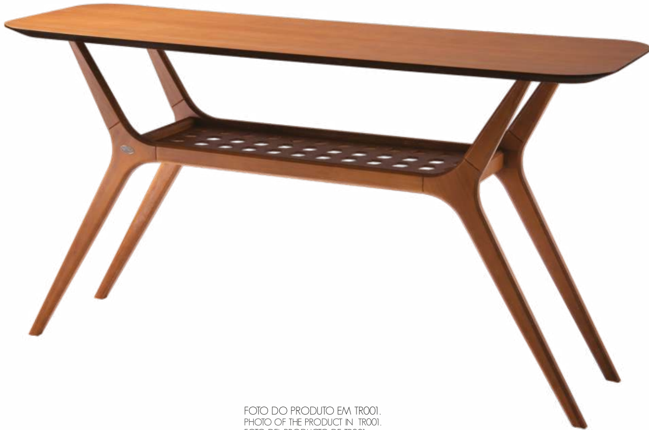
FOTO DO PRODUTO EM TRO01. PHOTO OF THE PRODUCT IN TRO01. FOTO DEL PRODUCTO DE TRO01.

CxPxA / medidas em mm LxDxH / measures in mm CxPxA / medidas en mm