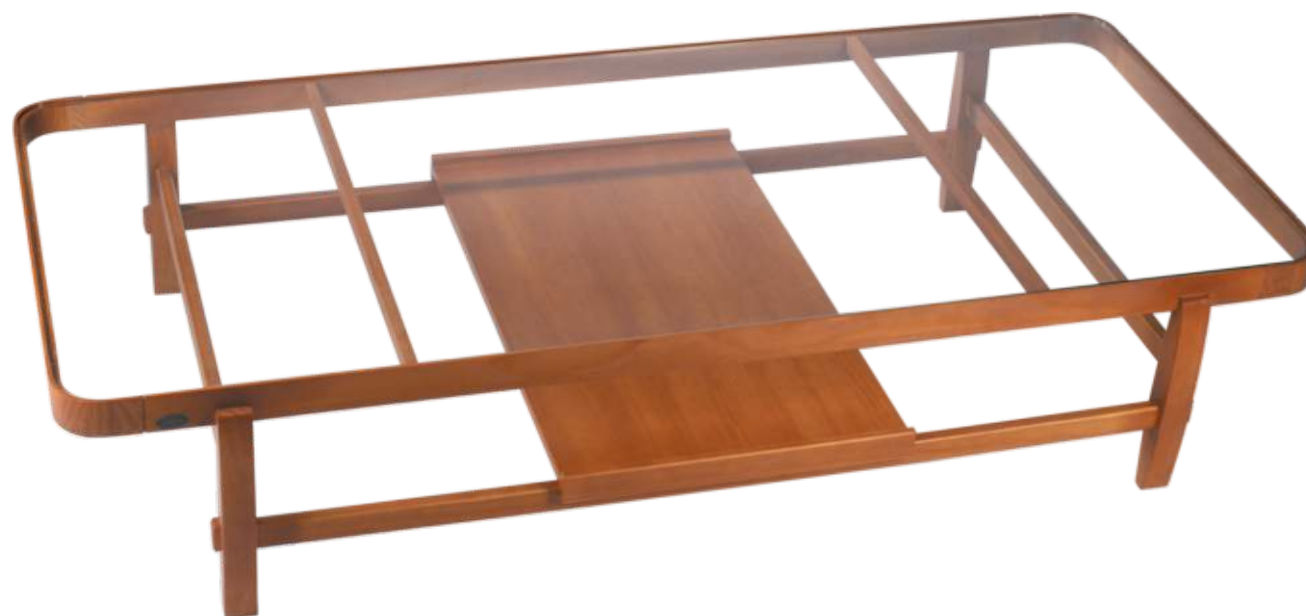
FOTO DO PRODUTO EM TROOI. PHOTO OF THE PRODUCT IN TROOI. FOTO DEL PRODUCTO DE TROOI.

CxPxA / medidas em mm LxDxH / measures in mm CxPxA / medidas en mm