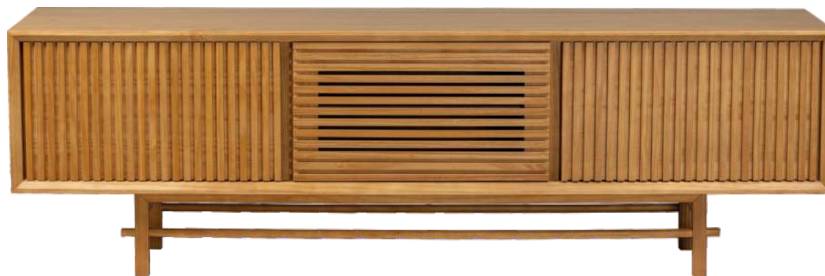
FOTO DO PRODUTO EM TR062 PHOTO OF THE PRODUCT IN TR062 FOTO DEL PRODUCTO EN TR062

FOTO DO PRODUTO: CAIXA EM TR052. PORTAS E PÉS EM TR001. PRODUCT PHOTO: BOX IN TR052. DOORS AND FEET IN TR001. FOTO DO PRODUCTO: CAJA EN TR052. PUERTAS Y PIES EN TR001.