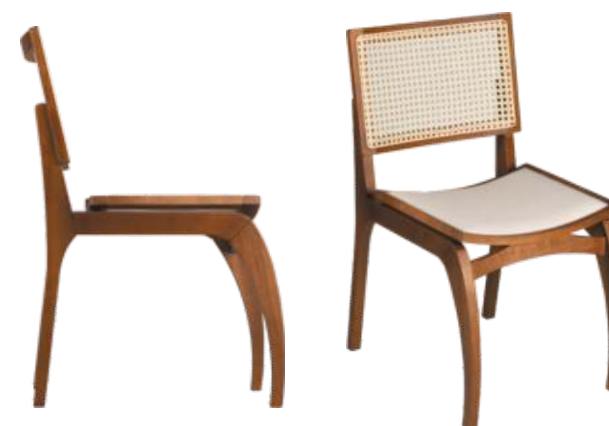
FOTO DO PRODUTO EM TR036. TECIDO 0014877. PICTURE UNIT IN TR036. FABRIC 0014877. FOTO DEL PRODUCTO DE TR036. TEJIDO 0014877.

FOTO DO PRODUTO EM JEQUITIBÁ NATURAL. TECIDO 0031008 PHOTO OF THE PRODUCT IN JEQUITIBÁ WOOD. FABRIC 0031008 FOTO DEL PRODUCTO EN JEQUITIBÁ NATURAL. TEJIDO 0031008