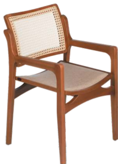
FOTO DO PRODUTO EM TRO01.TECIDO 0031011.PALHA FECHADA PICTURE UNIT IN TRO01.FABRIC 0031011.CLOSED STRAW. FOTO DEL PRODUCTO DE TRO01.TEJIDO 0031011.PAJA CERRADA.

FOTO DO PRODUTO EM TRO01. TECIDO 0031008.PALHA ABERTA PICTURE UNIT IN TRO01. FABRIC 0031008.OPEN STRAW. FOTO DEL PRODUCTO DE TRO01. TEJIDO 0031008.PAJA ABIERTA.