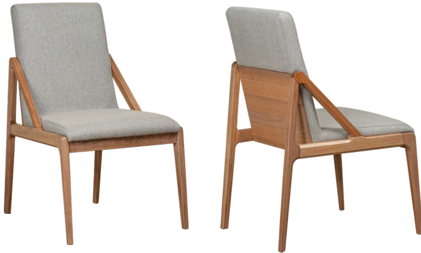
FOTO DO PRODUTO EM JEQUITIBÁ NATURAL TECIDO 0062619 PHOTO OF THE PRODUCT IN JEQUITIBÁ WOOD FABRIC 0062619 FOTO DEL PRODUCTO EN JEQUITIBÁ NATURAL TEJIDO 0062619

CxPxA / medidas em mm LxDxH / measures in mm CxPxA / medidas en mm