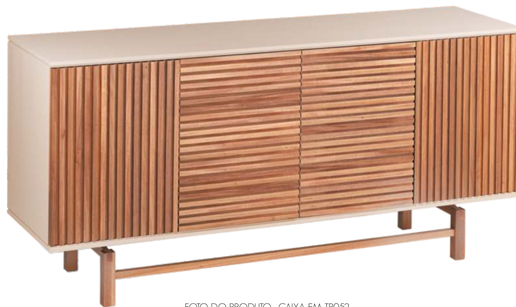
FOTO DO PRODUTO: CAIXA EM TR052, PORTAS E PÉS EM JEQUITIBÁ NATURAL PRODUCT PHOTO: BOX IN TR052, DOORS AND FEET IN WOOD JEQUITIBÁ FOTO DO PRODUCTO: CAJA EN TR052, PUERTAS Y PIES EN JEQUITIBÁ NATURAL

CxPxA / medidas em mm LxDxH / measures in mm CxPxA/ medidas en mm