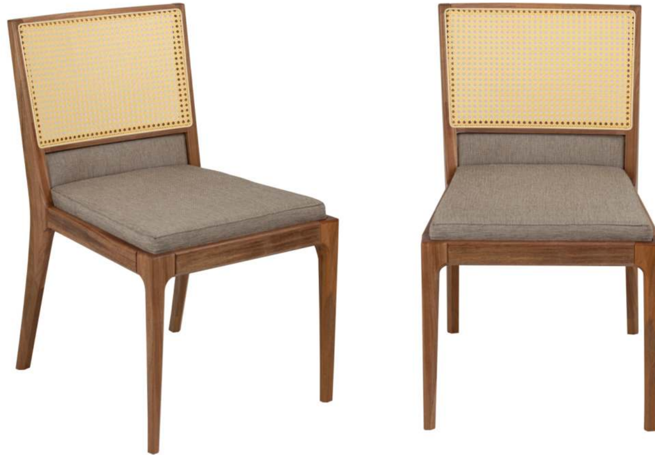
FOTO DO PRODUTO EM JEQUITIBÁ NATURAL. TECIDO 0016242. PALHA ABERTA. PICTURE UNIT IN JEQUITIBÁ WOOD. FABRIC 0016242. PEN STRAW. FOTO DEL PRODUCTO EN JEQUITIBÁ NATURAL. TEJIDO 0016242. PAJA ABIERTA.

CxPxA / medidas em mm LxDxH / measures in mm CxPxA / medidas en mm