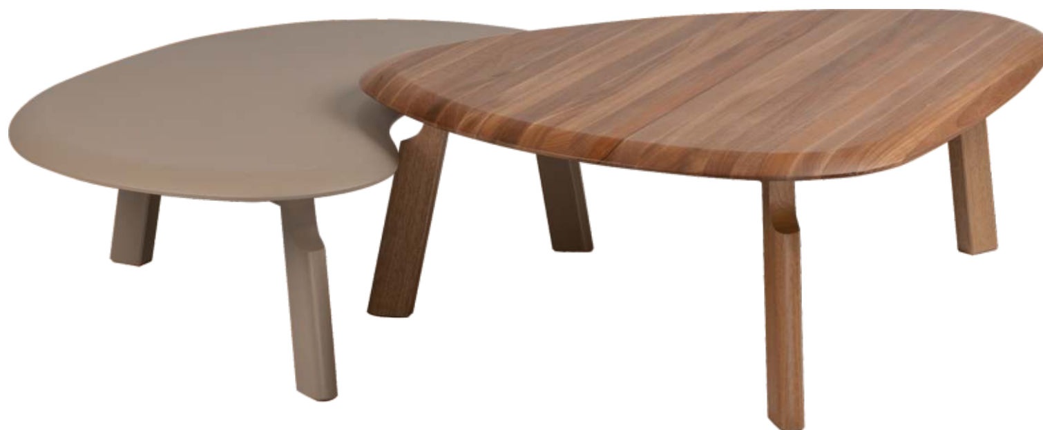
FOTO TREB2305 EM TR080 FOTO TREB2305A EM JEQUITIBÁ NATURAL PHOTO TREB2305 IN TR080 PHOTO TREB2305A IN JEQUITIBÁ WOOD FOTO TREB2305 EN TR080 FOTO TREB2305A EN JEQUITIBÁ NATURAL

CxPxA / medidas em mm LxDxH / measures in mm CxPxA / medidas en mm