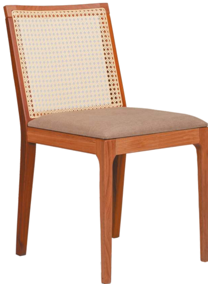
FOTO DO PRODUTO JEQUITIBÁ NATURAL. TECIDO 0031017. PALHA ABERTA. PICTURE UNIT IN JEQUITIBA WOOD. FABRIC 0031017. PEN STRAW. FOTO DEL PRODUCTO EN JEQUITIBÁ NATURAL. TEJIDO 0031017. PAJA ABIERTA.

CxPxA / medidas em mm LxDxH / measures in mm CxPxA / medidas en mm