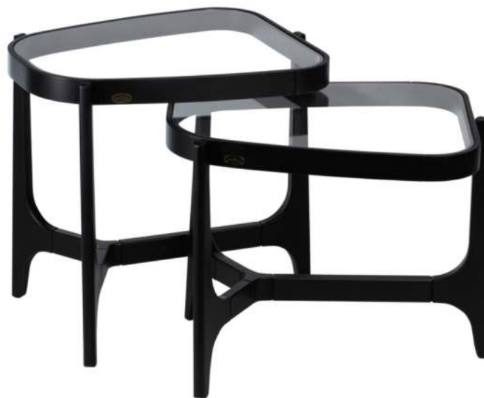
FOTO DO PRODUTO EM TR009. PHOTO OF THE PRODUCT IN TR009. FOTO DEL PRODUCTO DE TR009.

CxPxA / medidas em mm LxDxH / measures in mm CxPxA / medidas en mm