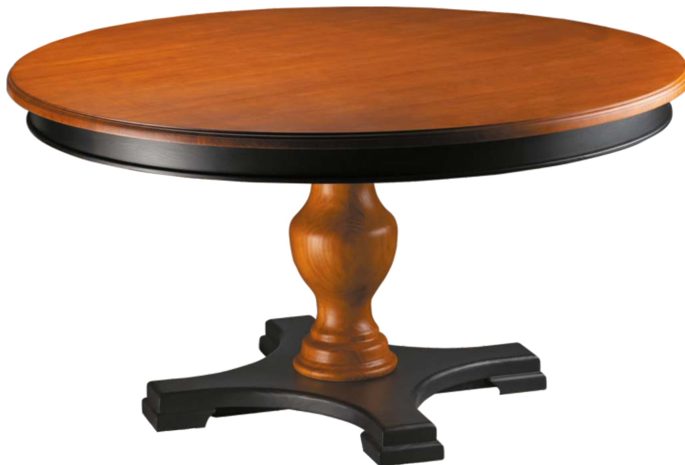
FOTO DO PRODUTO: BASE E SAIA EM TRO09. COLUNA E TAMPO EM TRO01. PICTURE UNIT: BASE AND SKIRT IN TRO09. TOP AND COLUMNAR PEDESTAL IN TRO01. FOTO DEL PRODUCTO: BASE Y ENVOLTURA DE TRO09. COLUMNNA Y TABLERO DE TRO01.