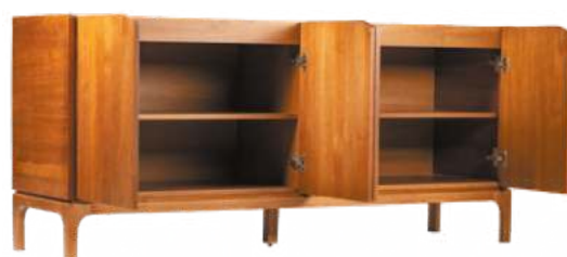
FOTO DO PRODUTO EM TR036. PHOTO OF THE PRODUCT IN TR036. FOTO DEL PRODUCTO DE TR036.