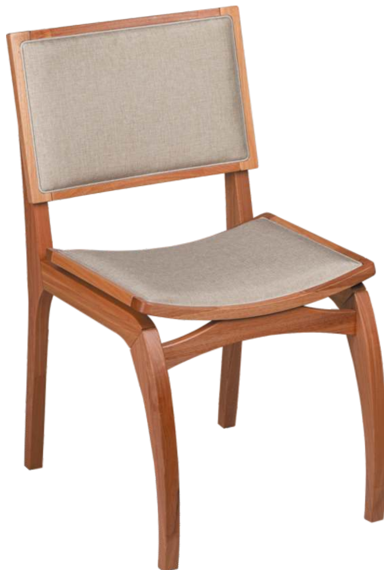
FOTO DO PRODUTO EM JEQUITIBÁ NATURAL. TECIDO 0031008 PHOTO OF THE PRODUCT IN JEQUITIBÁ WOOD. FABRIC 0031008 FOTO DEL PRODUCTO EN JEQUITIBÁ NATURAL. TEJIDO 0031008

CxPxA / medidas em mm LxDxH / measures in mm CxPxA / medidas en mm