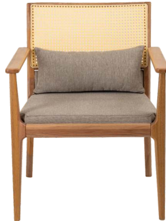
FOTO DO PRODUTO EM JEQUITIBÁ NATURAL TECIDO 0016242 PHOTO OF THE PRODUCT IN JEQUITIBA WOOD FABRIC 0016242 FOTO DEL PRODUCTO EN JEQUITIBÁ NATURAL TEJIDO 0016242