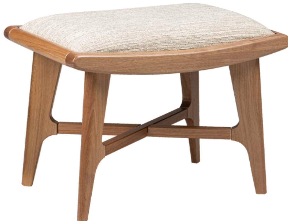
FOTO DO PRODUTO EM EM JEQUITIBÁ NATURAL. TECIDO 0062615. PICTURE UNIT IN JEQUITIBA WOOD. FABRIC 0062615. FOTO DEL PRODUCTO EN JEQUITIBÁ NATURAL. TEJIDO 0062615.

CxPxA / medidas em mm LxDxH / measures in mm CxPxA / medidas em mm