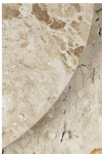
FOTO DO PRODUTO EM JEQUITIBÁ NATURAL; PEDRA NATURAL BEGE BAHIA ESCOVADO PHOTO OF THE PRODUCT IN JEQUITIBÁ WOOD ; BRUSHED BAHIA BEIGE NATURAL STONE FOTO DEL PRODUCTO EN JEQUITIBÁ NATURAL ; PIEDRA NATURAL BEIGE BAHIA CEPILLADA