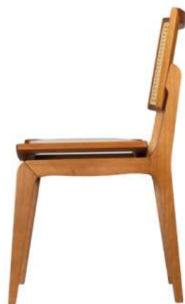
FOTO DO PRODUTO EM TRO01. TECIDO 0014877.PALHA ABERTA PICTURE UNIT IN TRO01. FABRIC 0014877.OPEN STRAW. FOTO DEL PRODUCTO DE TRO01. TEJIDO 0014877.PAJA ABIERTA.