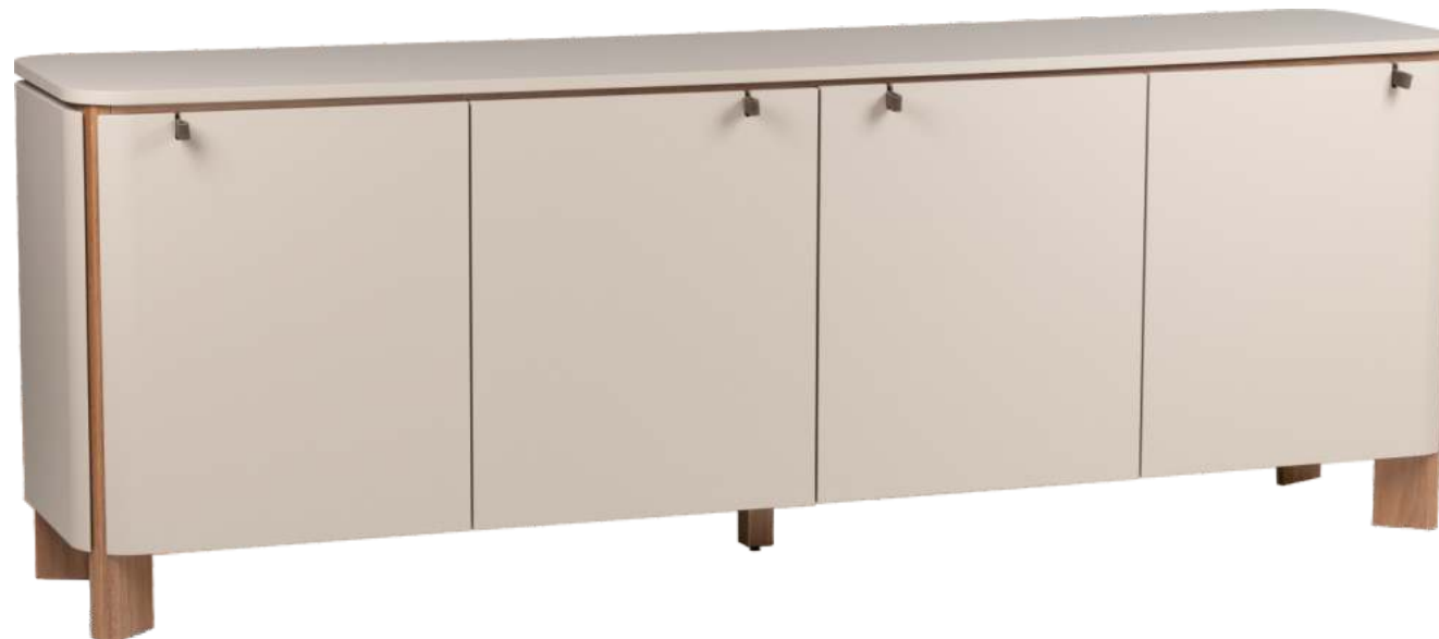
FOTO DO PRODUTO EM TRO52 PÉS EM JEQUITIBÁ NATURAL PHOTO OF THE PRODUCT IN TRO52 FEET IN JEQUITIBÁ WOOD FOTO DEL PRODUCTO EN TRO52 PIES EN JEQUITIBA NATURAL

CxPxA / medidas em mm LxDxH / measures in mm CxPxA / medidas en mm