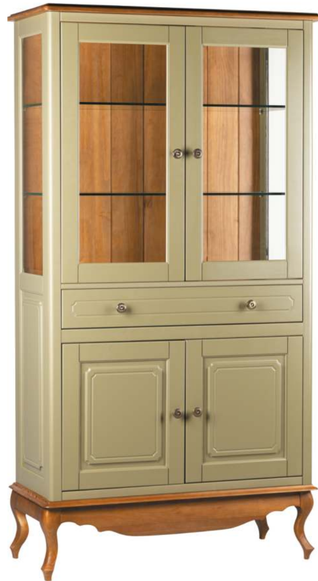
FOTO DO PRODUTO: CORPO EM TR055. PÉS, FUNDO E TAMPO EM TR036. PRODUCT PHOTO: BODY IN TR055. FEET, BACKGROUND AND TOP IN TR036. FOTO DEL PRODUCTO: CUERPO EN TR055. PIES, FONDO Y SUPERIOR EN TR036.

CxPxA / medidas em mm LxDxH / measures in mm CxPxA / medidas en mm