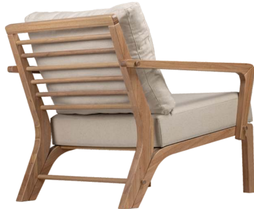
FOTO DO PRODUTO EM EM JEQUITIBÁ NATURAL. TECIDO 0031016. PICTURE UNIT IN JEQUITIBA WOOD. FABRIC 0031016. FOTO DEL PRODUCTO EN JEQUITIBÁ NATURAL. TEJIDO 0031016.