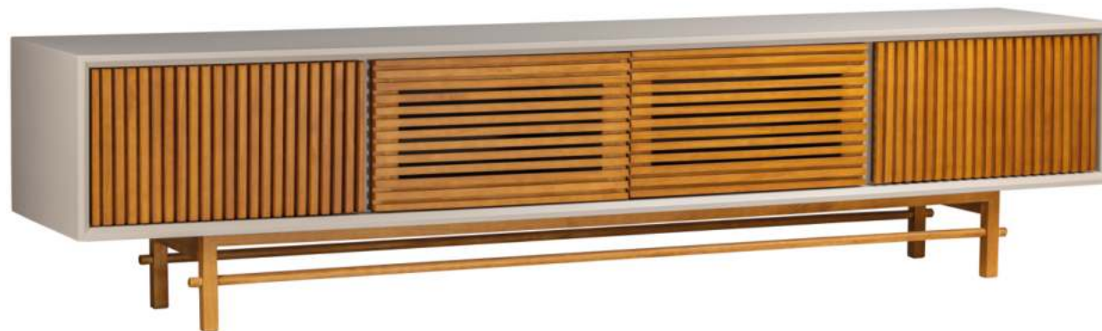
FOTO DO PRODUTO: CAIXA EM TR052. PORTAS E PÉS EM TR001. PRODUCT PHOTO: BOX IN TR052. DOORS AND FEET IN TR001. FOTO DO PRODUCTO: CAJA EN TR052. PUERTAS Y PIES EN TR001.

CxPxA / medidas em mm LxDxH / measures in mm CxPxA / medidas en mm