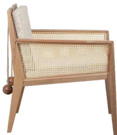
FOTO DO PRODUTO EM JEQUITIBÁ NATURAL TECIDO 0062615 PHOTO OF THE PRODUCT IN JEQUITIBÁ WOOD FABRIC 0062615 FOTO DEL PRODUCTO EN JEQUITIBÁ NATURAL TEJIDO 0062615