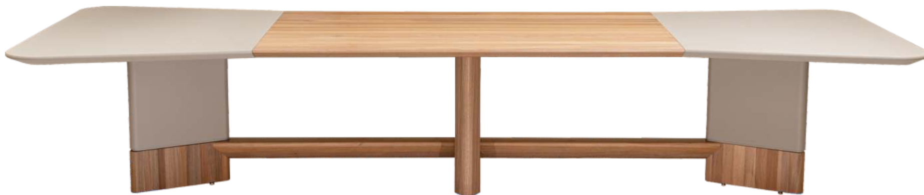
FOTO DO PRODUTO EM JEQUITIBÁ NATURAL + TR080. PHOTO OF THE PRODUCT IN JEQUITIBÁ WOOD + TR080. FOTO DEL PRODUCTO EN JEQUITIBÁ NATURAL + TR080.