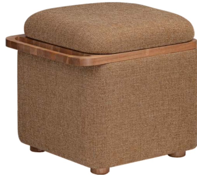
FOTO DO PRODUTO EM EM JEQUITIBÁ NATURAL. TECIDO 0062616. PICTURE UNIT IN JEQUITIBÁ WOOD. FABRIC 0062616. FOTO DEL PRODUCTO EN JEQUITIBÁ NATURAL. TEJIDO 0062616.