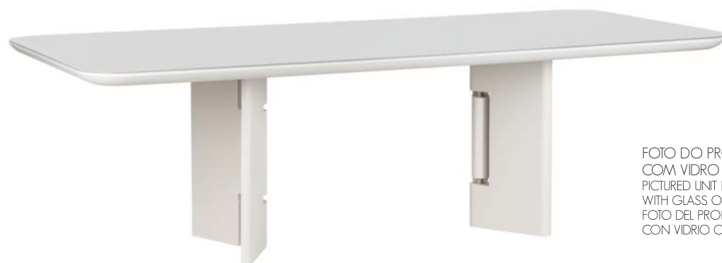
FOTO DO PRODUTO EM TR051 COM VIDRO OFF WHITE PICTURED UNIT IN TR051 WITH GLASS OFF WHITE FOTO DEL PRODUCTO DE TR051 CON VIDRIO OFF WHITE