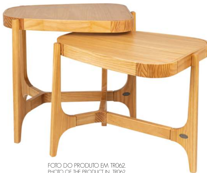
FOTO DO PRODUTO EM TR062. PHOTO OF THE PRODUCT IN TR062. FOTO DEL PRODUCTO DE TR062.